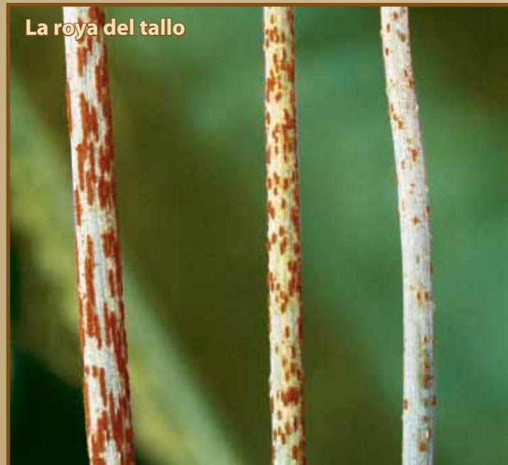
Figura 3. Ejemplos de la variabilidad en síntomas causados por la roya del tallo (abajo), la roya de la hoja (superior derecho), y roya amarilla o rayada (inferior derecho).

Las tres enfermedades tienen interacciones singulares con las variedades más comunes de trigo y cebada. Estas interacciones pueden modificar los síntomas de la enfermedad resultando en la reducción del tamaño de la lesión y variable en la cantidad de tejido amarillo o canela que rodea las lesiones (Figura 3). La familiarización con el rango de posibles síntomas para estas enfermedades mejorará la exactitud del diagnóstico y el manejo de estas enfermedades de importancia económica.