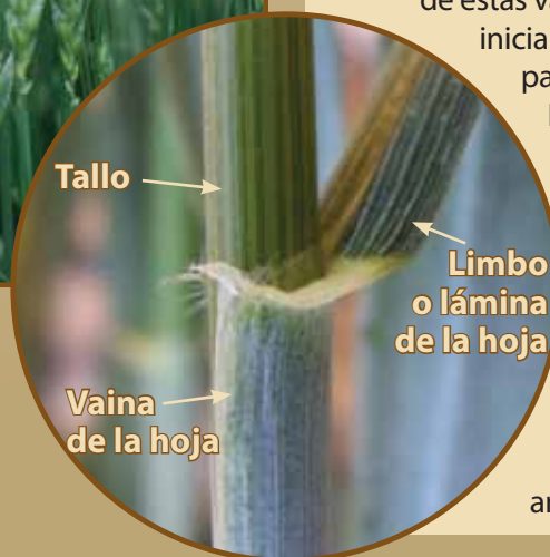
Figura 1. El diagnóstico de las royas requiere de un entendimiento básico de la anatomía vegetal y una revisión rápida de esta información puede mejorar la exactitud del proceso de identificación.

Una vez más, después de varias décadas de control con variedades resistentes a la enfermedad, nuevas razas de la roya del tallo están amenazando a la producción de grano en algunas partes del mundo. El primero de estas variantes, conocida como "Ug99", fue inicialmente reportado en los siguientes países del este africano: Uganda, Kenia, e Etiopía. Variantes adicionales también han emergido, complicando aún más los esfuerzos para contener el problema. La enfermedad continúa extendiéndose y quizás muy pronto amenace a la producción de trigo y cebada de Norteamérica. La detección rápida de nuevas razas es un componente importante de la respuesta internacional a estas amenazas de enfermedades emergentes.